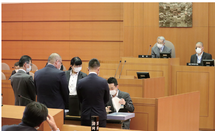
議長選挙開票の様子