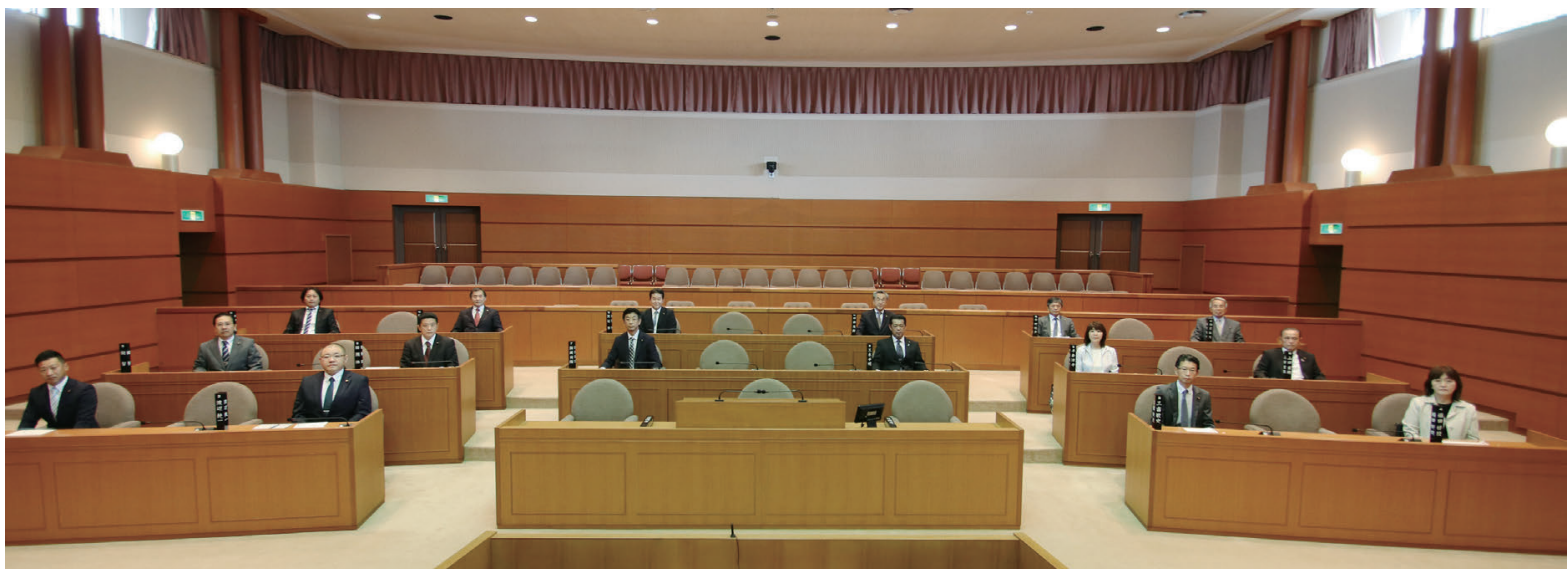
新たな顔ぶれの議員16人によりスタートします。