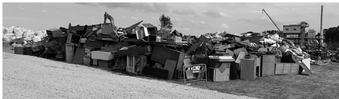
災害ごみの仮置場

令和元年台風第15号及び第19号に伴う災害復旧に要する工事などの経費等に、その財源となる地方交付税、国県補助金、市債などの歳入を計上し、令和元年10月16日に専決処分をしたもので、全員の賛成で承認しました。