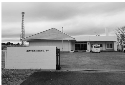
令和2年4月1日から開設予定の地域交流支援センター（旧天羽老人憩の家）

令和元年12月定例会は、11月28日から12月19日までの22日間で開催されました。議案17件、報告6件、継続審査議案6件について審議を行いましたので、その主なものを報告します。