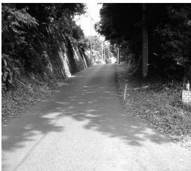
市道湊富士見台線の様子(最低でも3種5級の道路の幅員4.5mを確保し改修予定)