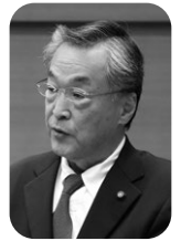
石井 志郎 議員