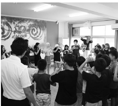
姉妹都市カールスバッドの高校生たちが小学校を訪れ、子どもたちと交流をしました。

教育長 富津市国際交流協会の依頼により、大貫小学校の児童と6月に姉妹都市であるカールスバッド市の高校生が、また、11月にはハワイのウクレレバンドの小学生の皆さんとの交流があった。民間団体を通じて外国の方々と交流することは、子どもたちの国際感覚を養う上で有意義な活動と考える。