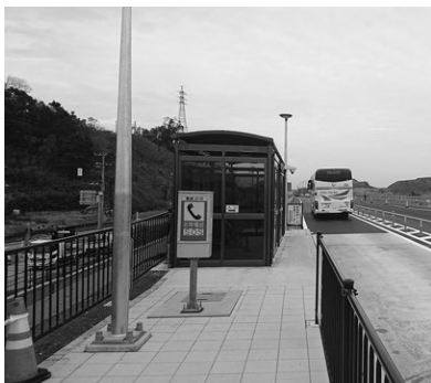
令和元年10月1日から4路線が利用できる浅間山バスストップがオープン

同プランでは、市の将来像を踏まえ、計画的な土地利用を進めていくため、用途地域を中心商業地、工業地、専用住宅地等に区分配置し、適切な土地利用を誘導していく。公共交通については、富津市地域公共交通網形成計画に基づき各種事業を進めており、タクシー運賃助成事業は7月から運用を開始した。また、10月1日に富津浅間山バスのストップがオープンし、房総なのはな号（白浜～東京線）、新宿なのはな号（館山～新宿線）、南総里見号（館山～千葉線）、館山～羽田空港・横浜線の4路線の利用が開始されたほか、二次交通手段として、バスストップ駐車場カーシェアリングサービスを導入した。