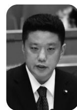
猪瀬 浩 議員