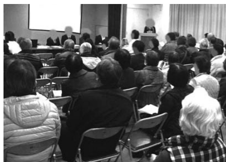
事業者による住民説明会の様子 令和元年11月8日に初めての住民説明会（約120名参加）が開催された

市長 市民の皆さんの不安にしっかりと寄り添って対応できるように行政を市役所一丸となつて、今後も進めていく。