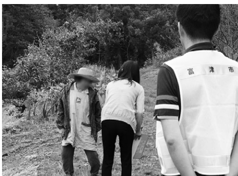
台風15号の被災後に高齢者の安否確認を行う介護福祉課職員

市長 今回のような大規模災害では、公助には限界があることから、個人での自助、地域での共助が重要である。このようなことから、自分ひとりでは災害時に避難が難しい高齢者や体の不自由な方に対し、隣近所が助け合って速やかに避難する仕組みづくりを行うことが大切。そこで、誰もが安心して暮らすことのできる地域をつくる