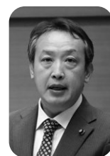
高木 一彦 議員