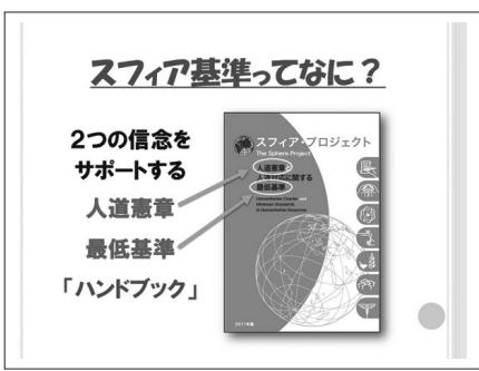
国際赤十字が作成。紛争や災害の際の避難所について、人間が人間らしく生きるための最低基準を定めている

市民部長 富津市では、太陽光発電システム、家庭用の燃料電池システム、定型リチウムイオン蓄電システム設置者に対して補助金を交付し、再生可能エネルギーの活用促進を図っている。