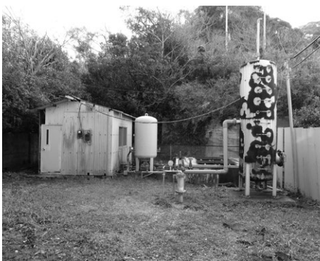
老朽化した金谷温泉給湯施設