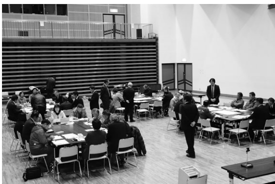
議会報告会の様子

行政組織または区として、災害発生時の行動や確認等のマニュアル作成と、対策訓練・シミュレーションの徹底。