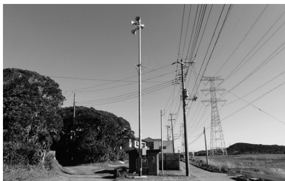
デジタル化するために更新された防災行政無線の子局