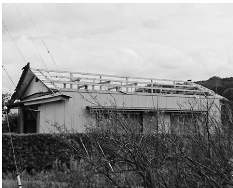
台風で屋根が飛ばされた東大和田区集会場

教育部長 佐貫中学校跡地の利用については、富津市の中央に位置し、地域で活動している団体等の状況を踏まえ文化・スポーツ・学習の拠点として活用することについて検討の一つと考えている。地