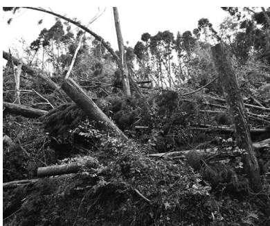
特に天羽地域では、民有林の倒木被害が甚大。個人の対応には限界があり、国庫の支援が必要