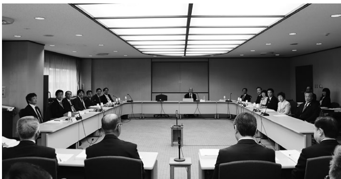
決算審査特別委員会の様子