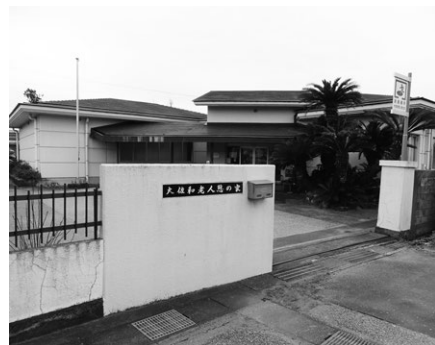
令和2年3月31日をもって廃止される大佐和老人憩の家

利用者の減少を廃止の理由としているが、高齢者が増え続ける中で、高齢者が集う場所は必要であり、否決とすべき。