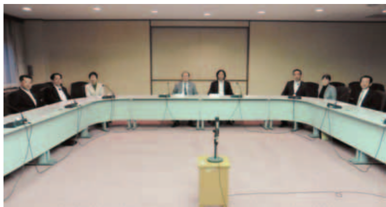
新たな教育福祉常任委員会のメンバー