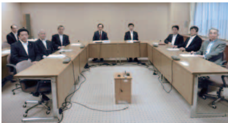
新たな総務産業常任委員会のメンバー