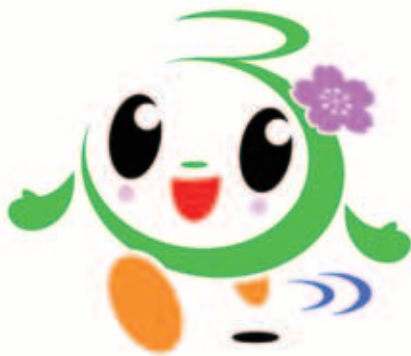
富津市おもてなしキャラクター「ふっつん」