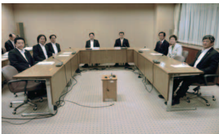
新たな議会運営委員会のメンバー