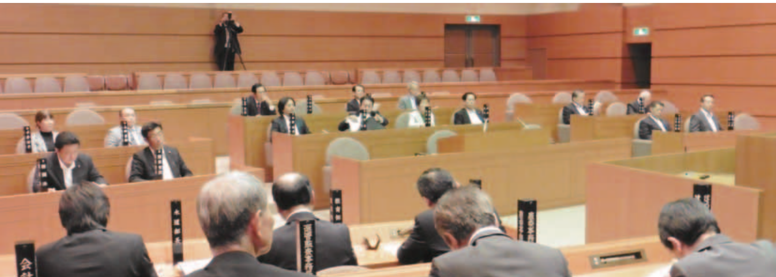
5月11日に開催された臨時会