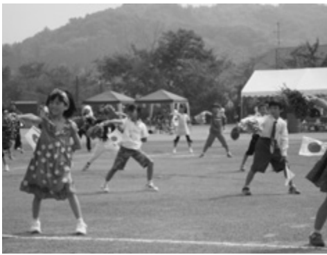
友達がたくさん出来ました(環小学校運動会より)

教育長 児童生徒の発達段階に応じ訓練・教育しているが安心・安全な学校づくりに一層努力する。