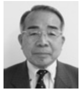
福原 敏夫 議員