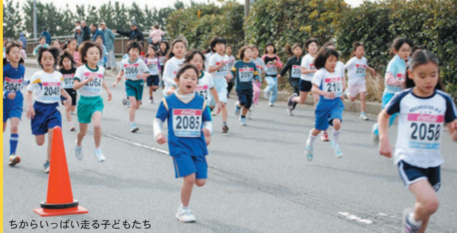
ちからいっぱい走る子どもたち

昨年から、富津市臨海陸上競技場周辺で行われるようになった千葉県民マラソン。 今年も、3月1日(日)に開催されます。 「おもてなしの心」で、参加者を歓迎しましょう！