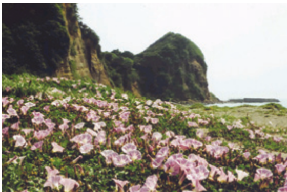
磯根海岸の浜屋顔

富津市内には、素晴らしい絶景スポットがあります。こっそり一人占めせず、歓びを分けて下さい。皆様のご応募をお待ちしております。