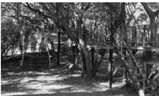
富津公園キャンプ場内に造られるツリーハウス、展望デッキと吊り橋や遊びゾーンが完成。さらに…

経環部長 情報交換や連携を図り各種イベントや催し物を実施している。今後も協働していきたい。