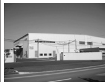
2月竣工予定のエム・エムプラスチック(株)

本社 東京都港区芝大門2-3-15 業種 低周波・高周波誘導電気炉による金属の溶融・金属の破碎及び合金鉄の製造 所在 新富72番1及び72番18 面積 15,000.03㎡ 雇用 10人