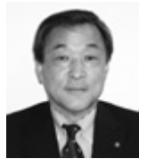
石井 志郎 議員