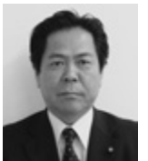
朗 岩本 議員