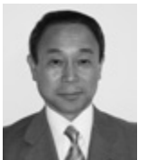
長谷川 剛 議員