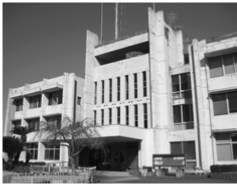
築40年が経過し老朽化が進む天羽行政センター

として厳しい財政運営が続くものと予想される。厳しい財政状況のもと、限られた財源の有効利用を図り、徹底した歳出の削減と自主財源の積極的な確保を図ることにより財源不足の解消に努めてまいりたい。 問 財源の確保として市有財産の売却とあるが状況は。 総務部長 10月・11月に三物件の一般競争入札を実施したが、入札参加者がなく不調に終わった。物件の新たな売却方法を検討する。 問 民有地への企業進出の現状は。 企財部長 出光跡地に予定している三甲(株)は来年2月に建築スケジュールを確定、12月ごろまでに工場を稼動する計画で進めている。