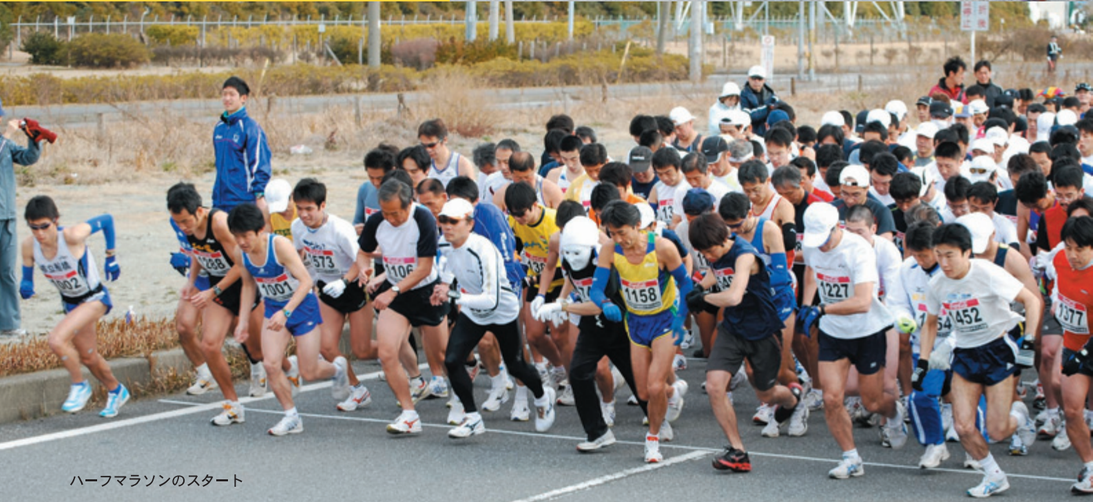
ハーフマラソンのスタート