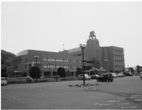
市の財政は、依然として厳しい状況が予測されている

市長 「企業誘致推進プロジェクト」として応募し、企業誘致条例に基づき、工場等を新設する企業に対し、操業開始から3年間を限度として奨励金を交付するものであり、平成20年度事業費は約5千2百万円となっています。