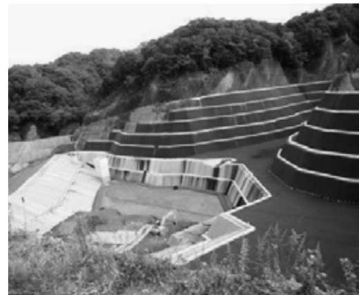
搬入が始まった第3処分場