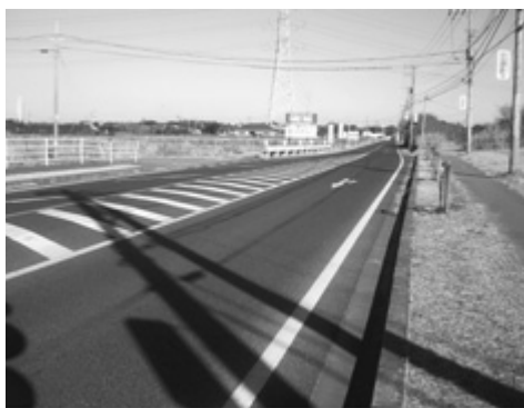
歩道設置のための測量が始まった、県道大貫青堀線

建設部長 歩道の設置については、既に測量を実施しており、用地買収後工事着手の見込みである。 問 西大和田神明山線の舗装計画は。 建設部長 歩行者や通行の安全を確保する上から、直営舗装で実施したいと考えている。 問 消防本部庁舎の進捗状況は。 消防長 神明山地区を含む庁舎周辺を候補地として検討している。 問 複合施設の進捗状況は。 教育部長 神明山周辺を候補地として進めている。 問 ボランティアに対する対応は。 市長 善行表彰の対象になるのかをこれから検討する。ご好意には非常に感謝している。