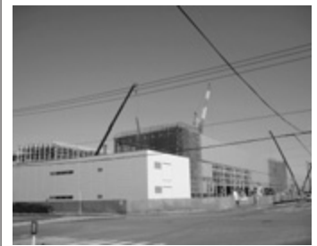
現在建築中の(株)荏原製作所

本社 東京都目黒区下目黒2-19-8 業種 レンタカー 所在 新富2番2・2番10及び3番6 面積 8,496.52㎡ 雇用 3人 契約日 平成20年7月14日