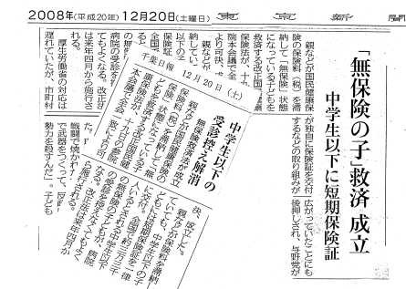
無保険の中学生以下の子供を救済する 改正国保法の可決・成立を報道する12月20付新聞

問 学校の行事で保険証を提示するのはどんな時か。 教育長 修学旅行や宿泊学習等。 問 短期保険証や資格証明書の子供たちへの対応は。 教育長 封筒に入れて提出。使用しなければそのまま返却。