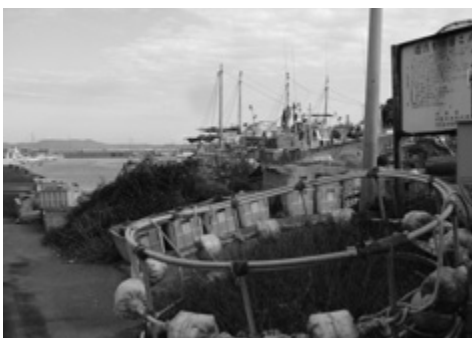
地場産業の活性化を！ 水産業の拠点（漁港と船舶）

市長 埋立て等による土壌の汚染及び災害の発生を未然に防止するため必要な規制を行う。独自に制限を加えた条例制定市町村の状況を調査し、研究を始めている。