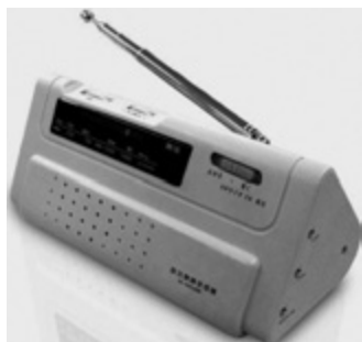
愛知県蒲郡市では、難聴地域に行政無線が聞ける防災ラジオを千円で販売している

市長 明確な所感は言えないが実施されれば市民への生活支援と地域の経済対策に資すると考える。