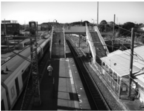
屋根の設置が待たれる青堀駅

市長 ホーム及び跨線橋への屋根の設置、駅舎の改修とトイレの水洗化などのほか、普通列車の増発、通勤通学時間帯等の快速列車の運行区間の延伸などの要望を行ってきたが、市としては、利用者の利便性を最優先と考え、引き続き屋根の設置や快速列車の乗り入れなど、粘り強く要望活動を行っていききたい。