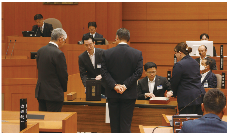
議長選挙開票の様子