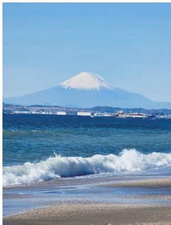
「下洲から望む富士」