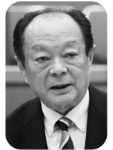
荒井 輝久 議員

市民部長 交通安全運動の実施に合わせ、ゼブラストップ活動などを市HPおよび広報ふつつに掲載するとともに、安全安心メールで周知啓発を図っている。