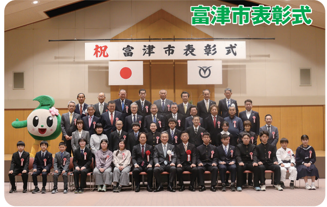
2月5日に市役所大会議室で「令和7年度富津市表彰式」が開催され、平野英男議長・諸岡賛陞副議長が来賓として出席し、議長が挨拶を行いました。