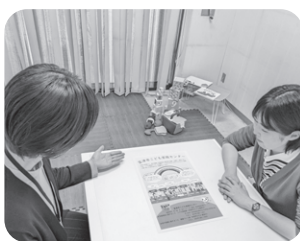
こども家庭課内に併設されている「こども家庭センター」

国の制度や先進事例を研究し、また、子育て世帯の意見を聞きながら施策を検討していく。