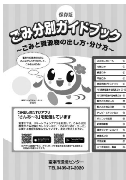
ごみ分別ガイドブック