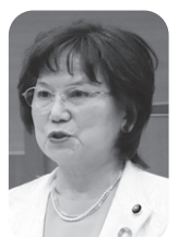
丸 優子 議員