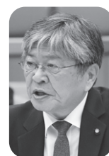
平野 明彦 議員