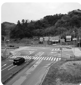
富津市道の駅候補地の1つ 交通の要所富津中央IC交差点付近

教育部長 学校再配置により通学距離が大幅に増加する児童に対しては、安全な通学手段を確保するため、スクールバスを運行し対応している。また、佐貫小学校区、富津小学校区では、路線バスの定期券購入費を全額補助している。保護者の負担を軽減し、遠距離通学の安全・安心を確保していく。