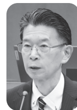
三富 敏史 議員