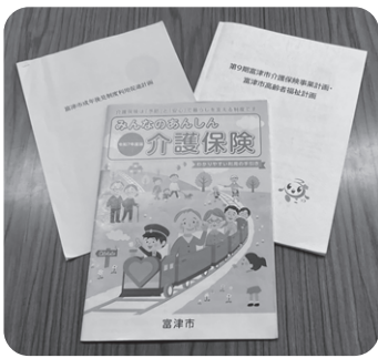
富津市の福祉施策、介護保険事業計画、高齢者福祉計画と成年後見制度利用促進計画

市長 ふつつ成年後見支援センター内に中核機関を設置し、法律・福祉・医療の専門職や地域の関係機関が連携して支援を行う。地域連携ネットワークを構築し、制度を必要とする人に早期対応を行うため、中核機関が中心となり相談・広報の体制を強化する。また、市長による申し立てを行った被後見人のうち、報酬を支払うことが困難な方には、報酬分の費用を助成している。高齢化により担い手不足が問題となっているが、社会福祉協議会等の法人による後見も活用していく。本人の意思を尊重して支援を行うための、補助や補佐制度を柔軟に活用するため、民法改正等を注視し対応する。