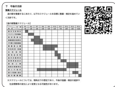
富津市「道の駅」基本方針（R6.2策定） に示される整備スケジュール

市長 将来にわたり持続可能で市民の皆さんにとって真に有効な施設となるよう、計画内容を丁寧に精査していくことが重要であると考えます。また、一定の時間を要する場合には2032年以降の開設もやむを得ないと認識しているが早期の実現に向け最大限努力していく。