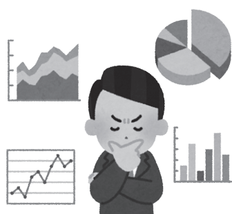
執行部が、市の戦略（策略）を練っている様子

建経部長 インフラ施設は定期点検結果に基づく長寿命化修繕計画により優先順位を定めている。