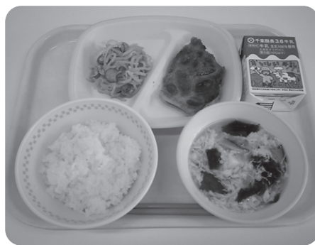
提供している給食

国の施策として、令和8年度から、市立小学校全学年の学校給食費の無償化を実施し、子育て世帯を支援します。