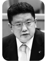
猪瀬 浩 議員