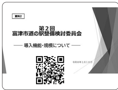
富津市道の駅整備検討委員会 議論されている会議資料等