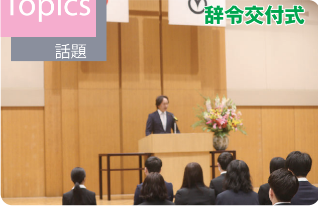
4月1日に市役所大会議室で「令和8年度職員辞令交付式」が開催され、平野英男議長・諸岡賛陞副議長が来賓として出席し、議長が挨拶を行いました。