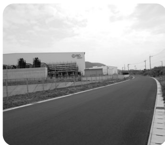
開通が待たれる市道浅間山線と操業を始めたサーモン陸上養殖場

建経部長 令和8年2月2日に操業および養殖生産を開始、令和9年3月上旬予定の出荷に向け事業を推進していくと聞いている。