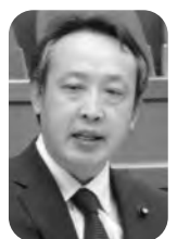
高木 一彦 議員