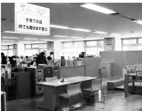
新設された「子育ての話何でも聴きます窓口」

市長 当市の保険税については市民の皆さんが負担感をお持ちとは思いますが、平成30年度から都道府県主体の財政運営、いわゆる広域化に移行する上で、県から広域化後の標準保険料率の提示や28年度決算見込み額などを踏まえ考慮し、市民の皆さんの負担増にならないよう検討してまいります。