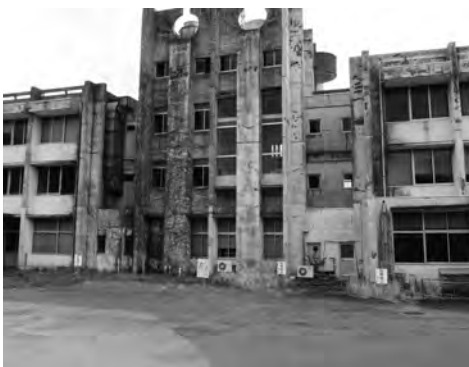
解体予定の旧天羽行政センター

市長 平成29年度予算の核となるソフト事業としては、まず、ひとの創生として、第3子以降の保育料無料化や特定不妊治療費助成事業、子育ての話何でも聴きます窓口の新設、放課後学習教室の試行など、少子化対策から子育て世帯への支援、将来を担う子供たちの教育環境に係るもの。