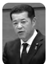
三木 千明 議員