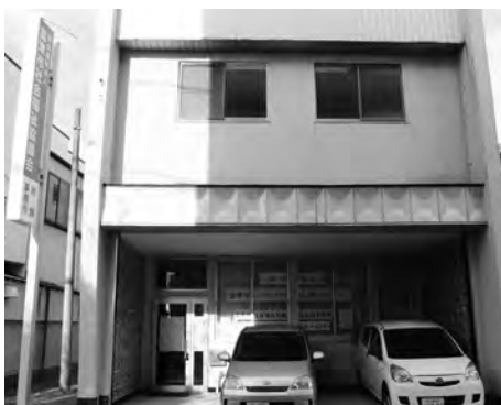
一般社団法人富津市シルバー人材センター

高齢者に就業機会を提供し、生きがいの充実及び社会参加の促進を図る富津市シルバー人材センターへの運営費を補助。