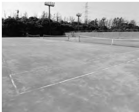
市民ふれあい公園テニスコート

市民ふれあい公園テニスコート10面を人工芝生コートに改修する。(スポーツ振興くじ助成金が活用出来ない場合、翌年度以降に延期)