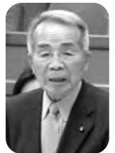
藤原 敏夫 議員