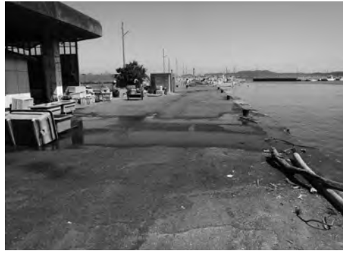
市内の漁港の様子