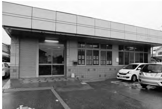
地域包括支援センター