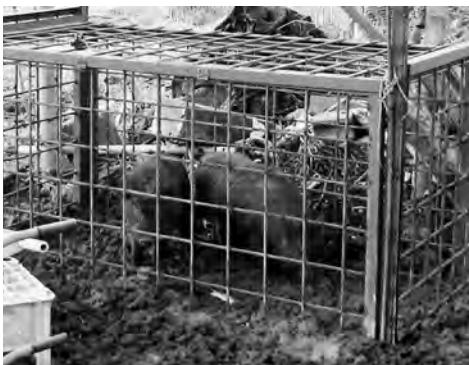
捕獲された2頭のイノシシ

は埋設により処分されている。しかしながら、かねてより捕獲従事者から処理施設設置の要望があり、市としても県内20市町村で構成する千葉県中南部地域市町村野生鳥獣対策会議で広域への処理施設の建設について、千葉県へ継続して要望を行っているところであるが、進展が見られない状況である。そのような状況の中、昨年末南房総市で民間事業者がイノシシ等の処分施設の実証実験をしたとの情報を得て、現地視察を行った。当市においても、処分方法について検討している中で、民間事業者と協力して処理施設の実証実験を実施に向けて調整中。