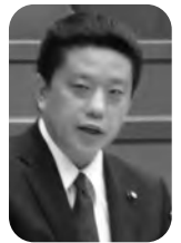
猪瀬 浩 議員

問 富津市職員人材育成基本方針・行動計画が改定されることと 思うが、タフネゴシエーターの育 成を考えてほしい。市民を丸め込 もうとするのではなく、まずは市 の意向を市民にしっかり伝え、市 民の話を耳を傾ける。その上で、 様々なバランスを考慮して、最適 だと思ふ計画を練り上げ、市民に 納得してもらえような交渉がで きる人材を育成していく必要があ ると思うが、どうか。