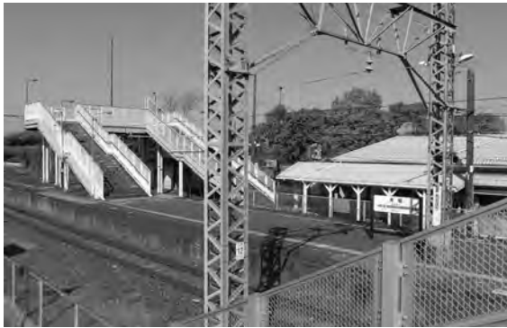
バリアフリー化が予定される青堀駅

JRが青堀駅バリアフリー化（エレベータ、障害者用トイレ等）に対応するための概略設計調査をする補助金支出。（平成29年度設計調査／平成30年度以降工事予定）