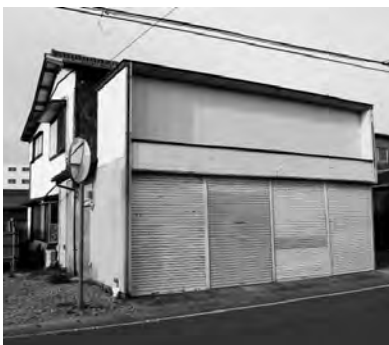
市内の空き家2,660軒の有効活用のために「住宅セーフティネット法」の活用を。

建経部長 この告知については、「千 葉県あんしん賃貸支援事業」を県 が実施。県のホームページ上にも 一覧が掲載されている。市のホー ムページや広報でも知らせたい。