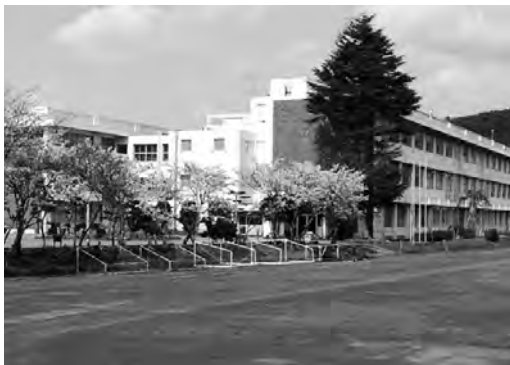
改築予定の天羽中学校

市長 人の創生については、具体的には不妊治療助成制度の導入、子育ての話何でも聴きます窓口の開設、第3子以降の保育料無料化、母子手帳の電子化などを進め、子育てしやすいまち日本一の実現に向け努力していく。まちの創生については、第1に住民力、第2に地場産業の力、第3に雇用力を考え、生活利便性の維持向上や相互に助け合う地域づくりを支援していく。しごとの創生については、先程の3つの力に加え魅力的な観光資源が富津市にはあるので活用していく。