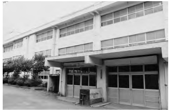
老朽化が激しい天羽中学校