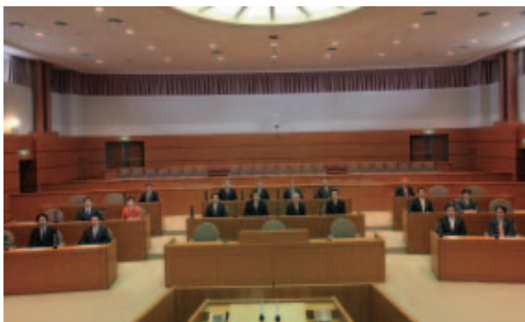
議長席から見た新たな顔ぶれの議員席