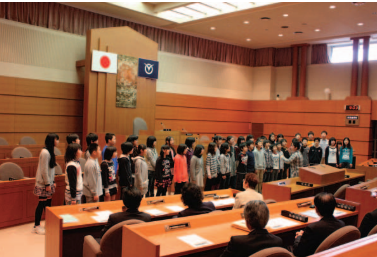
第9回の議場コンサートは、吉野小学校の6年生42人による合唱等でした。校歌斉唱をはじめとして、「春はあけぼの」「小を積んで大を為す」の詩を元気いっぱい朗読してくれました。改めて、言葉の美しさや力強さを感じました。