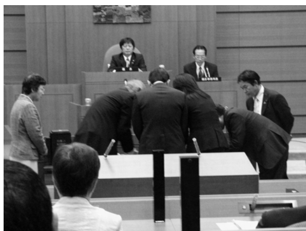
傍聴席から見た議長選挙開票の様様