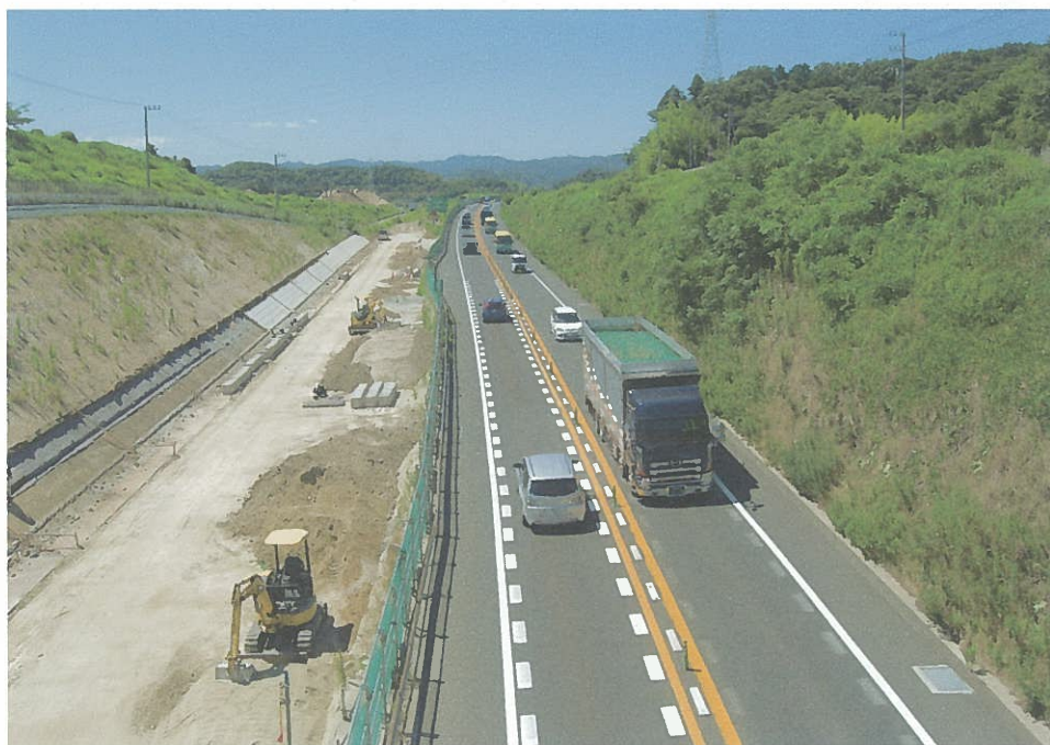
富津市鶴岡の館山道橋上より館山方面を見る。この数百メートル先に、バスストップができる予定。現在、片側 2 車線工事が進行中。

今年度中に、富津市公共交通網の計画が完成する予定となっております。計画が一日も早く実行されることを強く期待するとともに、本研究会も、その実現に向け、今までの研究結果を活かし尽力したいと考えております。