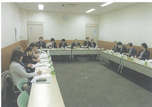
君津市の担当者、及び委託業者から、デマンドタクシーについて説明をうける。上総地域交流センターにて。