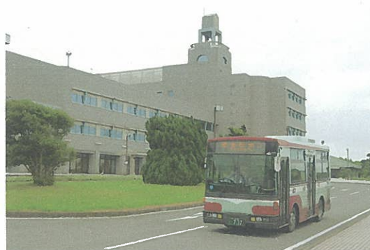
大貫駅東口を出発し、富津市役所を通り君津駅南口まで行く「富津市役所・君津駅線」。