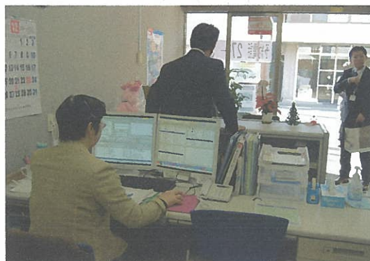
委託業者の大新東株式会社・君津デマンド営業所で、予約システムの視察。