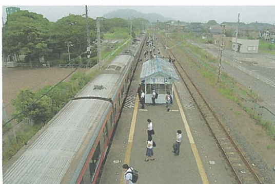
上総湊駅発6:58の通勤快速。7:11に青堀駅の跨線橋から撮影。京葉線回りで、8:36東京駅着